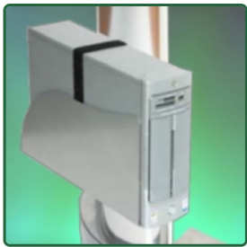
Support Large UC pour Bras Médical Combo H Class INTOP Fixation Colonne Référence: 116.002

Appellez s'il vous plaît notre service à la clientèle afin de vérifier la compatibilité avec la station que vous avez sélectionné.