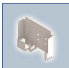
EGF 65141 Étui universel d'alimentation d'énergie