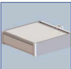
EGF 7500108 Tiroir fixation Murale