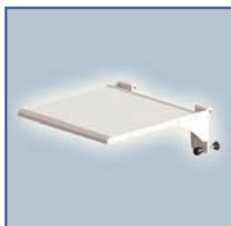
EGF 7500204 Plateau de travail fixation Murale