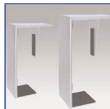
EGF 01488 Support Petit CPU Vertical