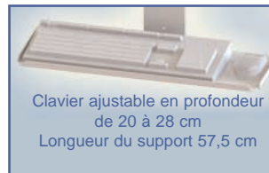
Clavier ajustable en profondeur de 20 à 28 cm Longueur du support 57,5 cm