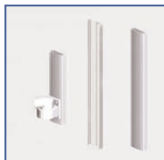
EGF 91142 Rail passage de câbles mural 120 cm