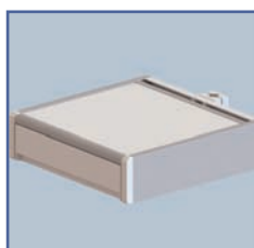
EGF 7500107 Tiroir fixation Din Rail