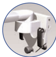
Fixation din rail