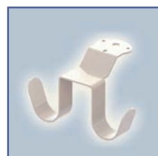
EGF 652129 Crochet de câble suspendu