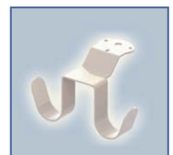
EGF 652129 Crochet de câble suspendu