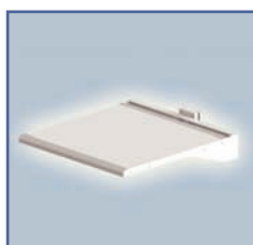
EGF 7500204 Plateau de travail fixation Murale